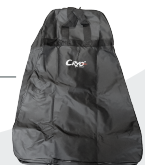
TRANSPORTVASKA REK 495:-