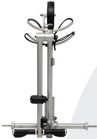
Cryo® Elvagn v2.5 SW med smal hjulbas 58 cm (std=68 cm)