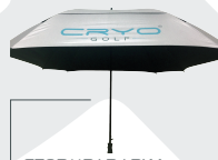
STORMPARAPLY REK 449:-