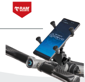
CRYO MOBILHÅLLARE TOUGH CLAW BY RAM MOUNTS REK 895:-